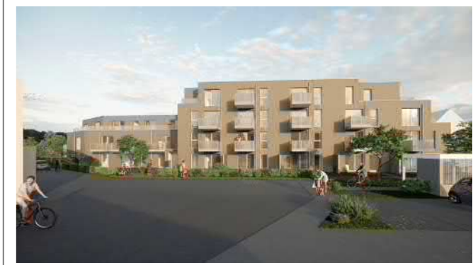
Wohnhaus An der Zeiselmaier 9, Wiener Neustadt